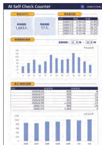
検温集計ダッシュボード画面イメージ ※正確な数値を保証するものではありません。